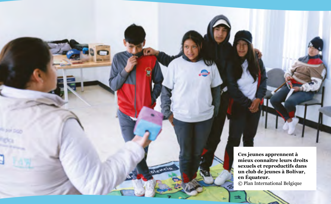
Ces jeunes apprennent à mieux connaître leurs droits sexuels et reproductifs dans un club de jeunes à Bolívar, en Équateur.