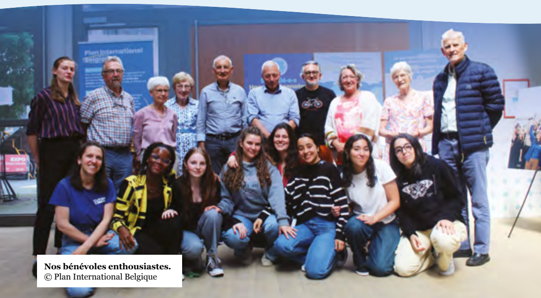
Nos bénévoles enthousiastes.

L e travail de Plan International Belgique ne serait pas possible sans l'engagement indéfectible d'une communauté fidèle qui soutient nos actions et notre mission.