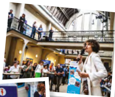
Soirée d'ouverture de l'exposition Dream4Girls aux Ateliers des Tanneurs à Bruxelles.

Le 11 octobre 2023, Journée internationale des filles , nous avons transformé le Mont des Arts à Bruxelles en une salle de classe symbolique, où 1 banc sur 7 était inaccessible. Une mise en scène percutante pour lancer notre campagne et sensibiliser le grand public et les responsables politiques à cette inégalité criante. Plus de 500 passant-e-s ont exprimé leur soutien en signant une immense bannière.